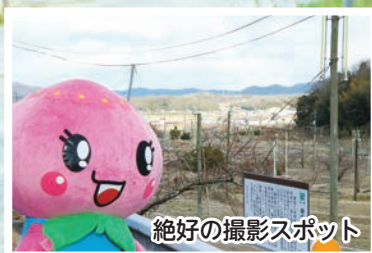
絶好の撮影スポット

今回は、赤磐市のマスコットキャラクター、あかいわももちちゃんと一緒に、映画「種まく旅人」のロケ地にもなった山陽地域鴨前の桃畑へ行ってみました。