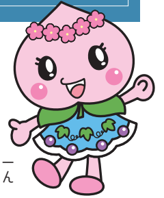
赤磐市マスコットキャラクター あかいわももちゃん

このコーナーでは 皆さんからの投稿を お待ちしております。 5月号は3月12日(火)が 記事の締め切りです。