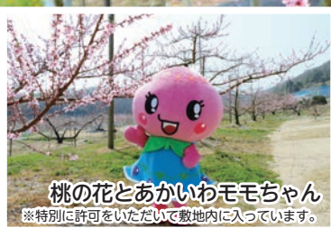
桃の花とあかいわももちちゃん ※特別に許可をいただいて敷地内に入っています。