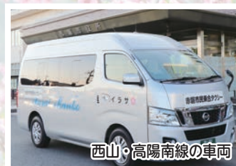
西山・高陽南線の車両

○お住まいの地域でどこをバスが走っているか分からない…という人のために、市ではバスの乗り方教室も開催しています。ご希望の場合はお問い合わせください。