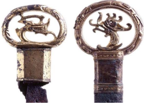
岩田 14 号墳 単龍環頭大刀

日本刀が作られる以前の古墳時代、刀剣は権力者の武威を示す副葬品としてあるじと共に埋葬されていました。1500年の時を経て発掘された鉄の刀剣は、長い年月でサビのかたまりとなっています。これらを後世に残すため、金属製品には化学的な保存処理を施してきました。保存処理の過程で新たな発見があることも少なくありません。在り日の輝きは取り戻せませんが、サビを落とし修復された豪族愛用の刀剣をご覧ください。