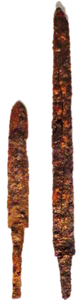
四辻 1 号墳鉄剣