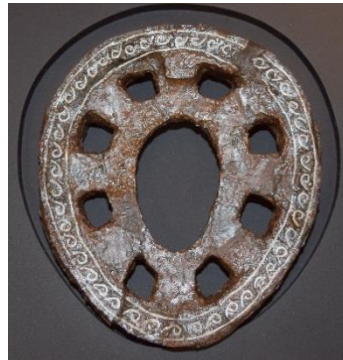
岩田 6 号墳 銀象嵌鏝