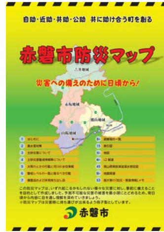
図 赤磐市防災マップ

本市では、指定避難所、指定緊急避難場所や土砂災害警戒区域、洪水浸水想定区域などを地図に表示した赤磐市防災マップを作成し、住民の皆様にお知らせしています。