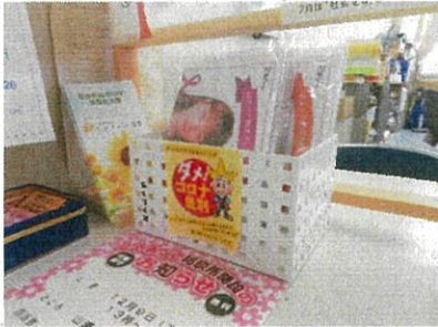
窓口啓発 (各公的機関)