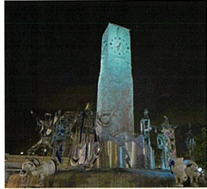
JR笠岡駅時計台(笠岡市)