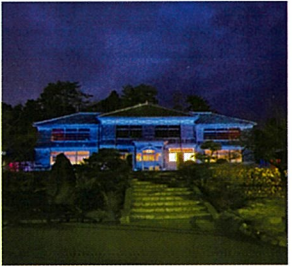
旧吹屋小学校(高梁市)