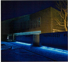
ペスタロッツ館(鏡野町)