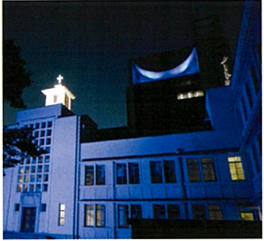
ノートルダム清心女子大学(岡山市)