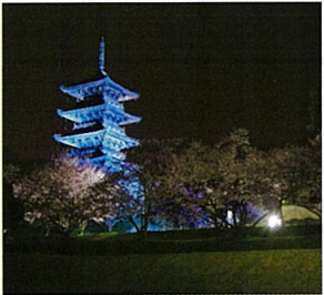
備中国分寺五重塔(総社市)