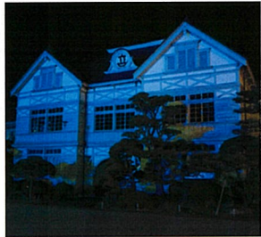
旧遷喬尋常小学校(真庭市)