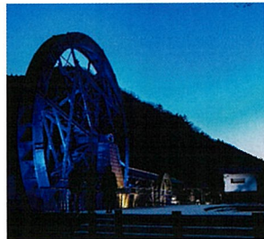
夢すき公園親子孫水車(新見市)