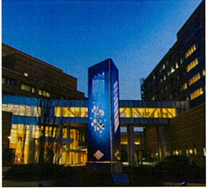
倉敷成人病センター(倉敷市)