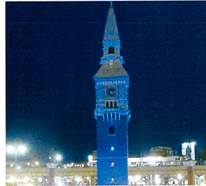
JR倉敷駅北口時計台(倉敷市)