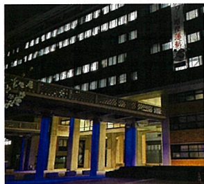
岡山県庁舎ピロティ(岡山市)