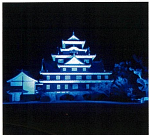
岡山城天守閣(岡山市)