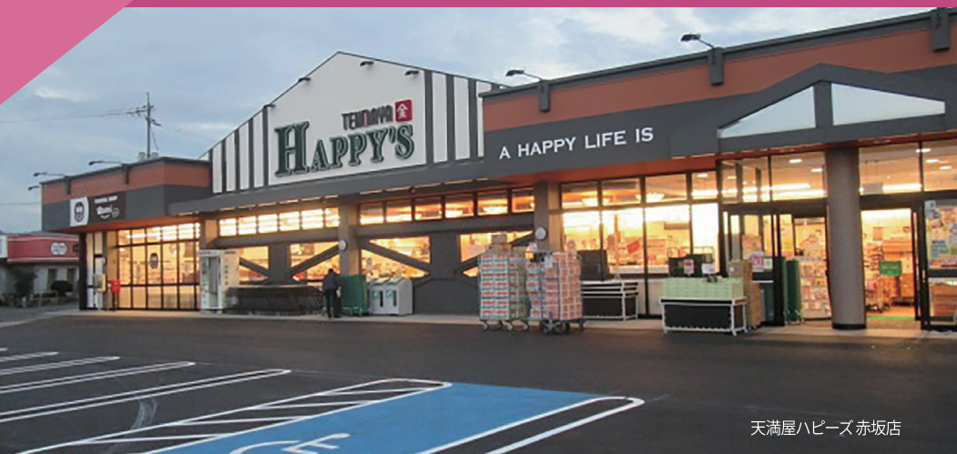
天満屋ハピーズ赤坂店