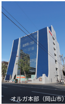
オルガ本部 (岡山市)

「生活協同組合おかやまコープ」は、一人ひとりが組合員となって参加、利用、運営する協同の力で成り立つ組織です。赤磐市内にはコープ山陽と赤磐配送センターがあります。当組合の特徴は地産地消の商品を多く採用していること。生産者の顔が見えるものだから安心安全です。宅配・店舗いずれも、食品から日用品まで選りすぐりの商品を取り揃えています。またCO・OP共済や福祉事業などでみなさまの「心ゆたかなくらし」を支えています。