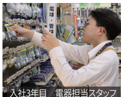
入社3年目 電器担当スタッフ

山陽店で電器担当として売場の管理を任されています。お客様の接客をして「ありがとう」と言われたときはとてもやりがいを感じます。仕事の中で生活に関わる知識が身につくことも魅力です。