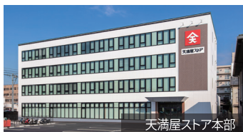
天満屋ストア本部

私たちは地域密着型のスーパーマーケットとして、お客様の暮らしに潤いと笑顔をお届けしています。生鮮食品やセブンプレミアムをはじめ、豊富な品揃えで魅力あるお店づくりを目指しています。まずは店舗で経験を積み、一人ひとりの強みを生かしてキャリアを築ける環境を整えています。将来的には、バイヤーや店長など選択肢が広がります。失敗を恐れず挑戦できる環境の中で、若い力が活躍できる職場を提供しています。