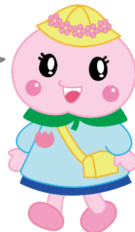
赤磐市マスコット キャラクター あかいわももちゃん

この手引きには、赤磐市の幼稚園または認定こども園(幼稚園部分)の支給認定、入園申込みに関する手続きや必要書類等について記載しています。内容をよく読んで、手続きを行ってください。 また、令和6年度中は大切に保管しておいてください。