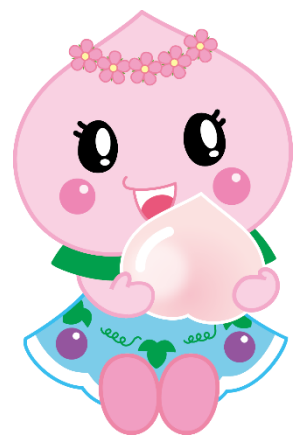
赤磐市マスコット キャラクター あかいわももちゃん