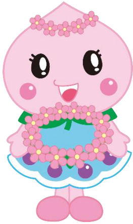
赤磐市マスコットキャラクター あかいわももちちゃん