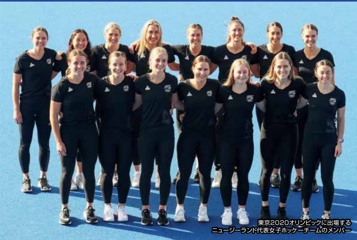
東京2020オリンピックに出場する ニュージーランド代表女子ホッケーチームのメンバー