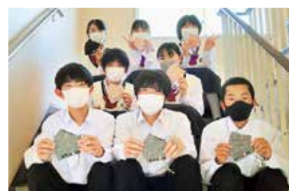
市民手作りのマスクにペイントしてくれた中学生(写真は赤坂中の生徒)