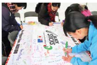
市民の思いが込められた応援フラッグ

ニュージーランド代表に選ばれた大半の選手は、2019年に赤磐市で事前キャンプをした選手たちです。コロナ禍でも高い目標に向かって素晴らしいチームに仕上がっています。 市民の皆さんが作ってくださいましたマスクや応援フラッグは、オリンピック開幕前にチームへ届けます。赤磐市でのオリンピック事前キャンプは実施できず、直接声を届けることはできませんが、みんなでエールを送りましょう。メダル獲得に向かって、がんばれニュージーランド！