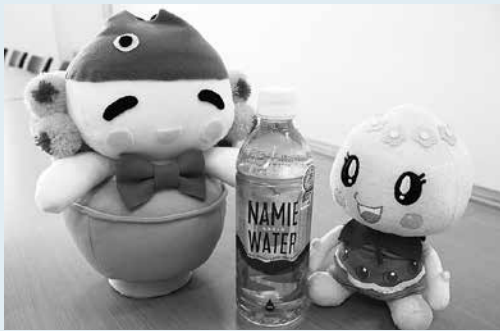
■問い合わせ先／本庁政策推進課政策企画班