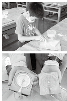
▶勾玉作り④と銅鏡作り⑥