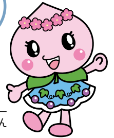
赤磐市マスコットキャラクター あかいわももちゃん

このコーナーでは 皆さんからの投稿を お待ちしております。 10月号は8月19日(木)が 記事の締め切りです。