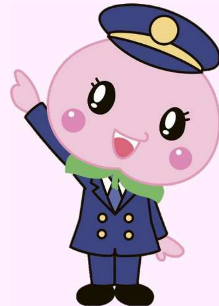
赤磐市マスコットキャラクター あかいわももちゃん