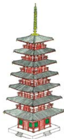
国分寺七重塔 想像図