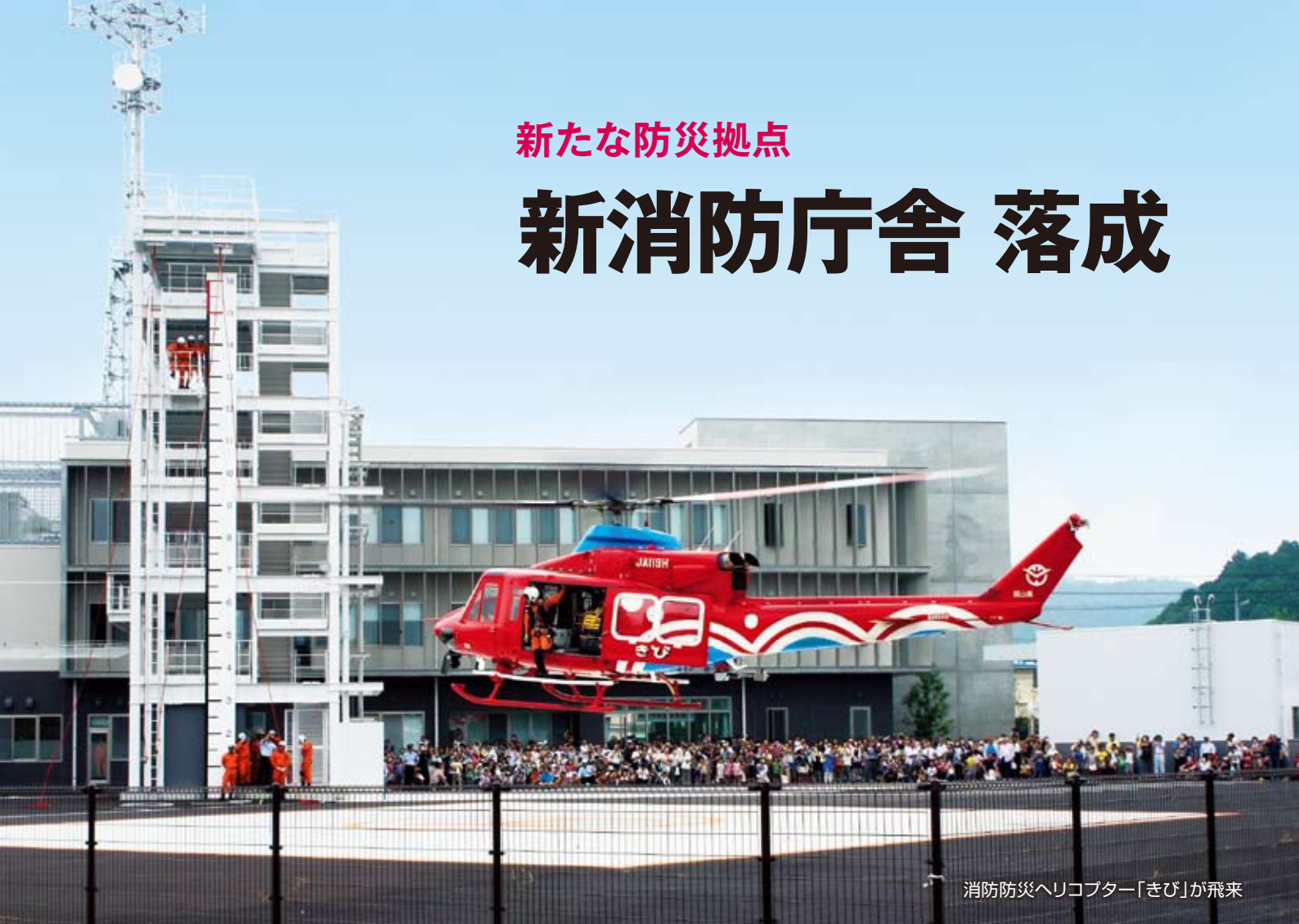
消防防災ヘリコプター「きび」が飛来

7月28日、赤磐市津崎の新消防庁舎で、落成を記念して式典とイベントが行われました。