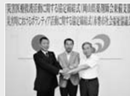
岡山県薬剤師会東備支部 赤磐市社会福祉協議会

このことにより、被災時の衛生問題への対応、避難所での医療救護活動の迅速化、避難所などでのボランティア活動の円滑化が期待されます。