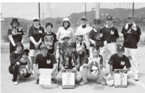
優勝の黒本Bチーム