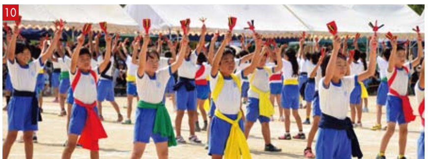
①ザ・玉入れ ②いざ、出陣! 綱引きだ! ③キラキラバルーン ④表現「レッツゴー うらじゃまつり」 ⑤親子でなかよく エッチラオッチラ ⑥競争遊戯「運べ! ビッグボール!」 ⑦遊戯「そらとべ あおむしくん」 ⑧準備体操「ZOOっと体操」 ⑨リレー「力を合わせて」 ⑩Let なるこ go!~なるこのままに~ ⑪親子競走「親子でヒーヒーエクササイズ」