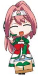
エコプラザあかいわキャラクター エコプラちゃん

例えば、子どもの成長が早くて着られなくなった衣類や読み終わった本など、ある人にとっては不要となったものでも、必要とする人に使ってもらうことで、ごみの減量化を目指します。あなたもエコのことを考えてリユースしませんか?