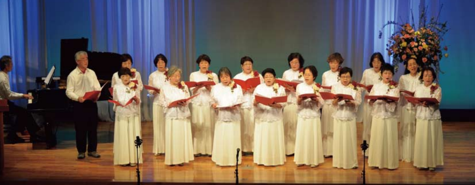
「美しい国」などを合唱するコーラスグループ・スイートピーの皆さん