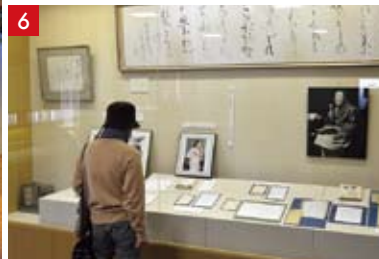
④⑤優秀賞受賞者が受賞作品を朗読 ⑥建物2階展示室には永瀬清子や谷川俊太郎さんの書簡などを展示 ⑦⑧市内小中学校の先生たちとの座談会の様子 ⑨市長から賞状を贈られる受賞者 ⑩朗読した受賞者にコメントを寄せる谷川俊太郎さん ⑪たくさんの人が朗読会を楽しみました