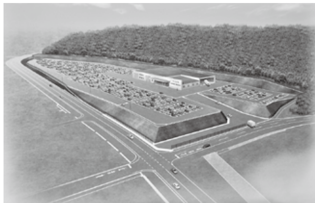
＜岡山ダイハツ販売「PDIセンター」のイメージ図＞

計画では、約25,000㎡の敷地に、事務所(約400㎡)、整備棟・倉庫(約2,000㎡)を設け、新車や中古車を一時保管するほか、納車前の整備・点検や、県内営業所への配送業務も行う予定で、12月の操業を目指しています。