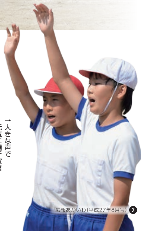
→大きな声で 元気に選手宣誓

5月30日と6月6日に、豊田小学校と5つの市立中学校で、運動会と体育会が開催されました。