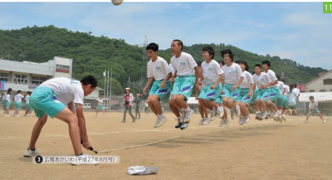
③ 広報あかいわ (平成27年8月号)