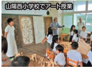
山陽西小学校でアート授業