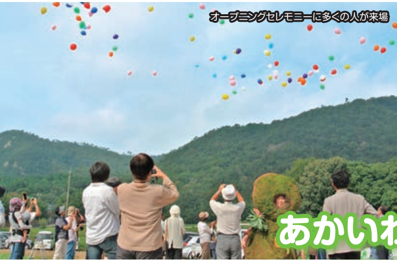
オープニングセレモニーに多くの人が来場