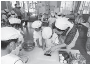
▶桜が丘幼稚園での活動

栄養委員は乳幼児期から高齢期まで各年代にあった食育を推進し、赤磐市が元気になるよう日々頑張っています!