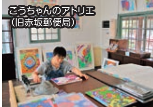
こうちゃんのアトリエ (旧赤坂郵便局)