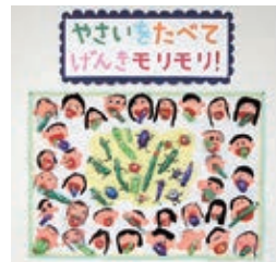
<幼児制作(団体)の部> ひかり幼稚園 (年長ひまわり・ゆり組)