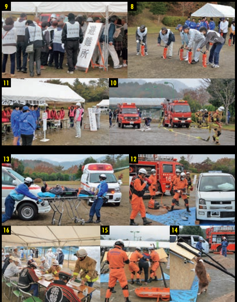
⑧ 自主防災組織による水消火器による初期消火訓練 ⑨ 赤坂ファミリー公園内に開設された避難所における被災者の受け入れ ⑩ 市消防本部と市消防団が協力して火災防ぎょ活動を実施 ⑪ 避難所に隣接して、災害ボランティアセンターを開設 ⑫ 市消防救助隊が救助活動を展開して事故車両から負傷者を救出 ⑬ 救急隊による傷病者搬送 ⑭ アウフ(災害救助犬)による倒壊家屋内の人命検索活動を実施 ⑮ 消防救助隊が倒壊家屋から負傷者を救出 ⑯ 災害対策本部の設置運用訓練 ⑰ 岡山県消防防災航空隊により土砂災害で孤立地域からの被災者の救出訓練 ⑱ 陸上自衛隊第13特科隊によるカレーの炊き出し訓練 ⑲ 展示コーナーで自衛隊の特殊車両を展示