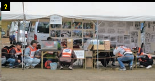
①市民のパケツリレーによる初期消火訓練 ②防災行政無線のサイレンを合図にシェイクアウト訓練を実施 ③警察官、消防団員による被災者の避難誘導訓練 ④岡山県消防防災航空隊のヘリコプター ⑤岡山県トラック協会による緊急物資搬送訓練 ⑥赤磐市建設業協会による道路に崩落した土砂を撤去する道路啓開訓練 ⑦容態が急変した被災者に対して、防災士によるAEDを用いた救命処置が実施される