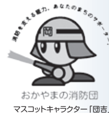
おかやまの消防団 マスコットキャラクター「固吉」