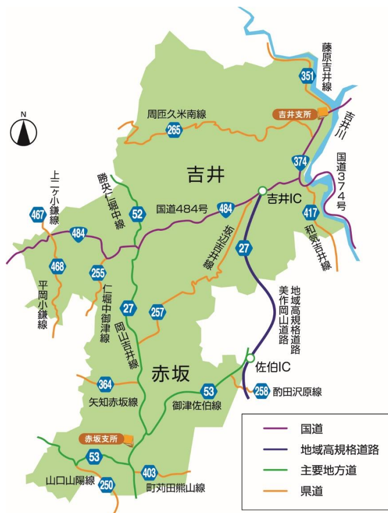
図2 過疎地域の道路網図

また、山陽自動車道山陽インターチェンジや中国自動車道美作インターチェンジ、岡山空港へもアクセスしやすい位置にある。県南の岡山市、県北の津山市どちらも経済圏に入り、広域交通網の整備等により、通勤、通学、レジャーなど住民の生活行動は地域の枠組みを超え、広範囲な行動圏となっている。