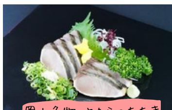
岡山名物 さわらのたたき