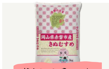
特Aランク きぬむすめ