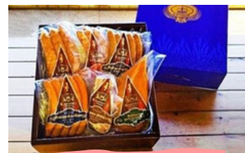
ソーセージセット