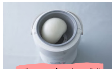
つき姫 コンパクトもちつき機