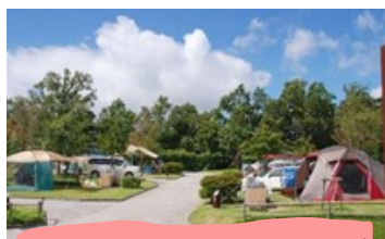
吉井竜天オートキャンプ場利用券

返礼品の一部をご紹介します！右記のQRコードから納税サイトにアクセスしてご覧ください。