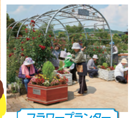
フラワープランター