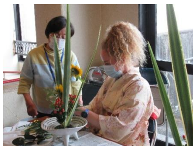
真剣な面持ちです。