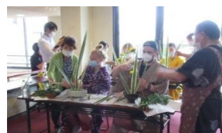
「楽しい作品」ができました。