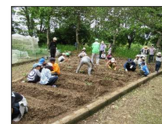
サツマイモの苗植え