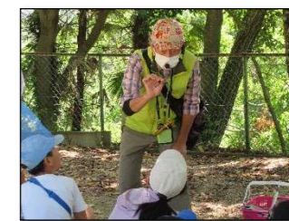
説明に耳を傾ける