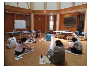
フットケアマッサージを体験