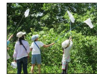
巧みに虫取り網で

公民館周辺のどんぐり山や岩田公園で虫取りをしました。子どもたちは虫取り網や虫かごを手に、思い思いに草むらをかき分け、虫を探しました。ひたすらチョウを追いかける子もいれば、カタツムリを見つけ、そっと虫かごに入れる子もいます。一人で果敢に挑む子もいれば、声を掛け合いながら数名で挑む子もいます。鮮やかにチョウを捕まえる高学年の姿を羨望の眼差して見つめる子もいます。その後、捕まえたコオニヤンマやキタキチョウ、カナヘビやノコギリカミキリなどの生態をボランティアに説明してもらいました。新たな気付きもあったようで、今回の学びが普段の生活の中でも生きることを期待しています。