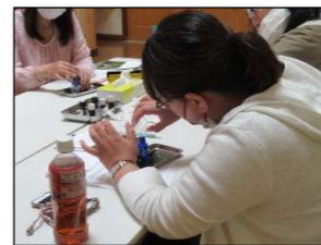
アロマトリートメントオイルを作製

アロマの精油の効果や作用、精油と植物の香りが健康維持や美容にも役立てることができるとなども学び、素敵な時間を過ごしました。