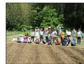
大きな玉ねぎが取れました

公民館に戻り、子どもたちはボランティアが作ったカレーを頬張りました。充実した活動となりました。