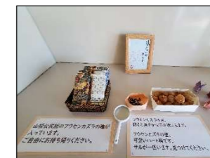
話題のフウセンカズラ