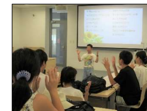
手話付きで歌おう