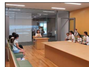
ディスカッション体験中

環太平洋大学を訪問し、模擬体験や施設見学などを行いました。構内では、ボランティアサークルの学生たちが施設の説明や模擬授業体験の進行を行ってくれました。ディスカッションルームでは、二つの菓子が提示され、どちらを選ぶか討論を行いました。また、学生に「ひまわりの約束」の手話を教えてもらい、みんなで歌いました。さらに、自分はどんな大人になりたいか、どんな世界をつくりたいか、一人ずつ発表しました。「幼稚園の先生になりたい」「笑顔いっぱいの世界をつくりたい」など、大学生と交流したことで将来の夢が少し広がったようでした。