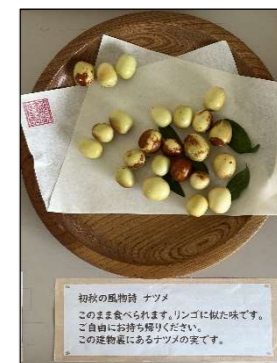
敷地内にあるナツメ

山陽公民館では、季節感を醸し出す空間づくりに取り組んでいます。公民館の敷地には、ナツメや姫りんごの木が植えられています。普段、出会う機会の少ない果実なので、職員が収穫し、玄関ロビーに展示していました。「子どもの頃、よく食べたわ。懐かしいわね」と話しながら食される方や「孫に見せたいので、いただいて帰っていかしら」と言われる方もいて、ささやかながら、一つの憩いの場となりました。