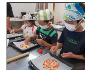
トッピングを思案中