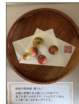
敷地内にある姫りんご