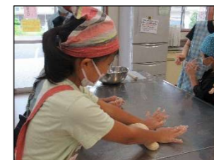
真剣に生地と向き合う

焼き上がり後は、ボランティアと一緒に、満足げにピザを頬張りました。今回の活動で身に付けたスキルが普段の生活にも生きることを願っています。