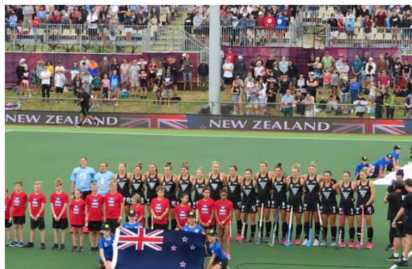
同日、ニュージーランド対オランダの試合を 観戦、応援しました