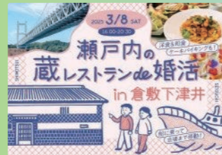
瀬戸内の蔵レストランde婚活