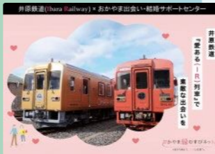
井原鉄道「愛ある(IR)列車」で素敵な出会いを ※上記は一例です