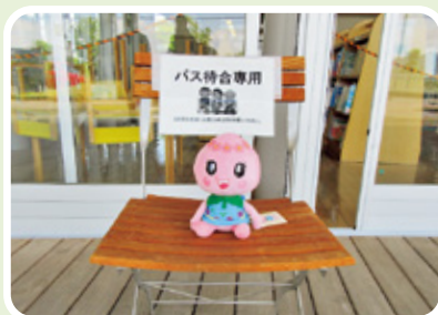
バス待合スペース