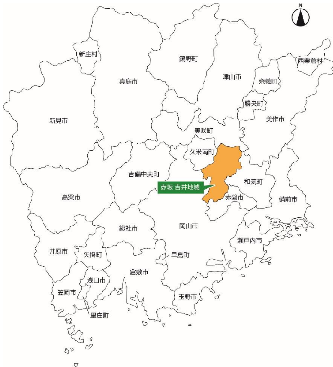
図1 赤磐市における過疎地域の位置

赤坂地域と吉井地域（以下、本地域）は、赤磐市の中中部から北部に位置しており、総面積 129.06 km 2 、中国山脈の支脈である山間地形に属し、標高 200～400m の山岳に囲まれている。西部は竜天山系や吉井高原などの高台地であるが、南部に向けて次第に低くなっている。また、吉井川や県一級河川の砂川が流れており、それらに沿って平野や耕地が形成されている。