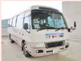
乗車定員28人 （座席18、立席10）