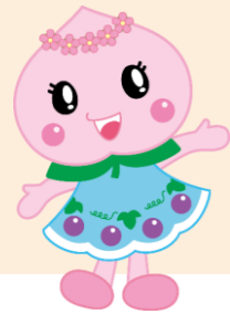
あかいわももちゃん