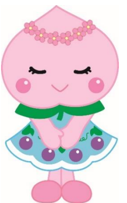
あかいわももちゃん